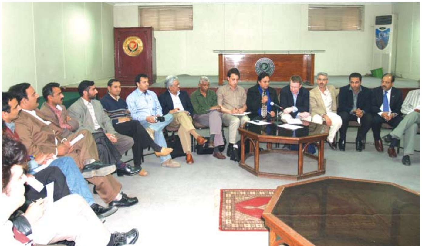
පාකිස්ථානයට කෙරුණු මෑත කාලීන අන්තර්ජාතික මාධ්‍ය නිදහසේ දුක මෙහෙවරයන් දේශීය සහ ජාත්‍යන්තර වෘත්තීය සංගම අතර සහයෝගිතාවය ගොඩ නැගීමට පියවර ගත්හ.

දේශපාලනය අපරාධකරණය සහ අපරාධ දේශපාලනිකරණය කරා වර්ධනය වීම මාධ්‍ය නිදහසට බරපතල අහියෝග මතු කර ඇත. සාම ක්‍රියාවලියෙන් පසුව මතුවූ සංසිද්ධියක් වන වාණිජ අවශ්‍යතාවයන්හි බලපෑම හා දැන්වීම් අදායම සඳහා ඇති තරඟය ඉහල යාම මාධ්‍ය නිදහස මත හානි කර බලපෑමක් ඇති කරයි. පෙර නිර්ණිතව සිටි ජනමාධ්‍ය ප්‍රජාව තුළ ඔවුන්ට නොදැනීම ස්වයං වාරණයක් බිහි වී ඇත. එනමුත් පැතිරයන සර්ව සුභවාදය සහ ප්‍රජාතන්ත්‍රවාදය සඳහා ඇති මහත් උනන්දුව හේතුවෙන් ව්‍යවස්ථාව සම්පාදනය වන තුරු ලබන වසර ඇතුළත ජනමාධ්‍ය ප්‍රජාවෙහි පැවැත්ම සහතික වනු ඇතිබව බෙහෝ දුරටම පෙනේ.