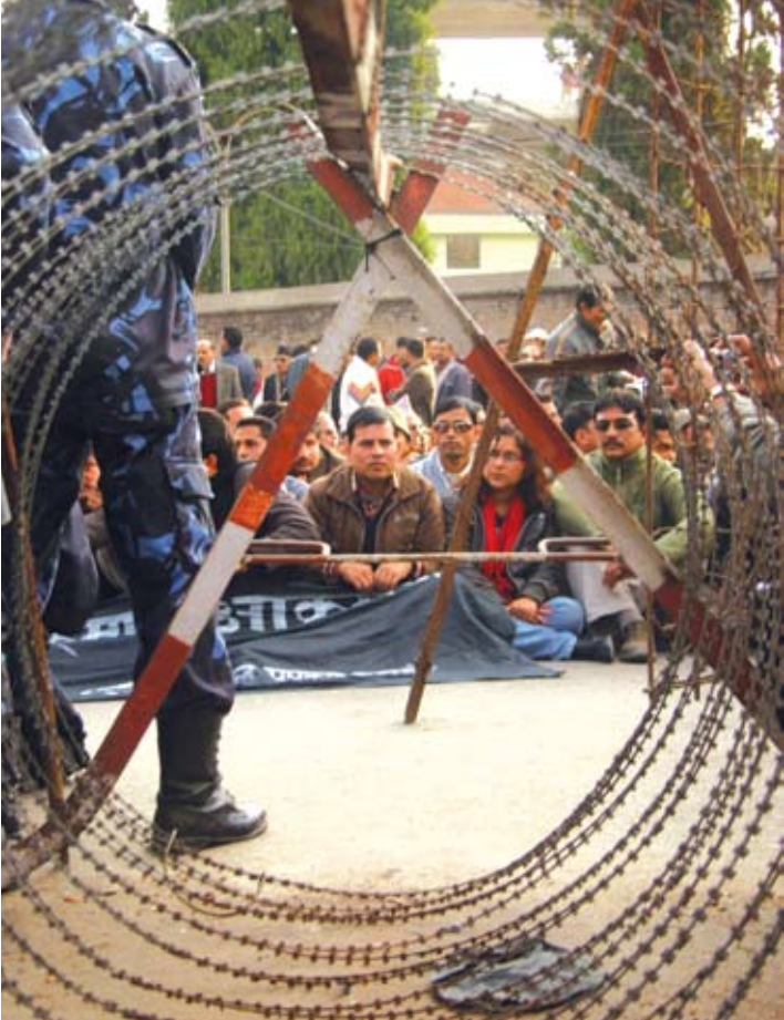
ජනමාධ්‍යවේදීන්ගේ රාජකීය ඒකාධිපතිත්වය පැවැති වර්ෂ පුරාම දෛනික ජීවිතයේ දුෂ්කර තත්ත්වයන් අත්විඳියේය.

තවමත් සිදු වෙමින් පවතින ප්‍රජාතන්ත්‍රවාදී පරිවර්ථනය මෙතෙක් සුමට බවක් පෙන්වුම් කර නොමැත. හිටපු මාවෝවාදී සටන්කාමීන් රාජ්‍යයේ ආරක්ෂක වැඩසටහනට එකතු කර ගැනීම මෙන්ම නව ව්‍යවස්ථාවක් සම්පාදනය කිරීමේ දුෂ්කර කාර්යය ද තවමත් කළ යුතුව ඇත. රටෙහි ස්ථිර දේශපාලන නායකත්වයක් නොමැති වීම තුළ පවත්නා සමාජ දේශපාලන සහ ආර්ථික අවිනිශ්චිත භාවයද ඉහළ නංවා ඇත.