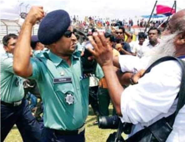
දකුණු ආසියාවේ ජනමාධ්‍යවේදීන් ඔවුන්ගේ වෘත්තීමය දෛනික ජීවිතයේදී කායික ප්‍රහාරයන්ට ගොදුරුවෙති. එමෙන්ම අතරින් පතර පෙනවීම් ජනමාධ්‍ය සමාජයට එල්ලවූ මරාගෙන මැරෙන ප්‍රහාරය වැනි මරණීය ප්‍රහාරයන්ගේ ද ඉලක්ක බවට පත්වෙති. ජීවන අරගලයේ අර්බුදයට ද මුහුණ දෙන ඔවුන්ට සාධාරණ වැටුප් සහ යහපත් වෘත්තීමය කොන්දේසි සඳහා බොහෝවිට විදී බැසීමට ද සිදුවෙයි.