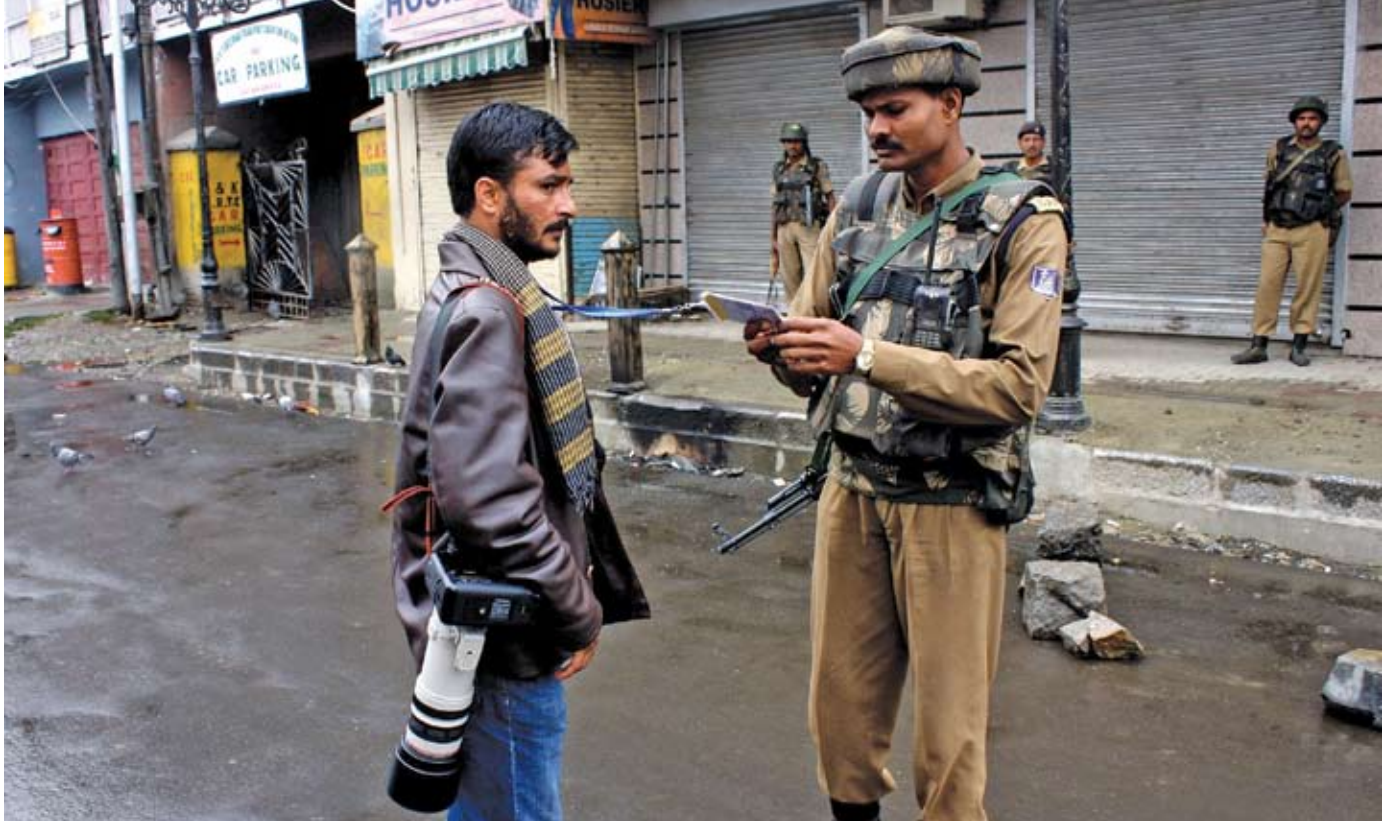
මෑත දී කළබලකාරී ක්‍රියා මැඩපැවැත්වීමට පණවන ලද සීමාවන් ඉවත්කරවා ගැනීමට දුෂ්කර සාකච්ඡාවන්හි නිරතවීමට ජනමාධ්‍යවේදීන්ට සිදුවිය.

ඉන්දියානු ජාතික අග නගරය මූලස්ථානය කොට ගත් තවත් වැදගත් ආයතන 2ක් වන ඉන්දියානු ජනමාධ්‍යවේදීන්ගේ සමාජ ශාලාව සහ කර්තෘ සංසදය කාශ්මීර් මාධ්‍යවේදීන් වෙනුවෙන් පැවැත් වූ සහයෝගීත්වය පෙන්වීමේ ක්‍රියාවන් වලට සම්බන්ධ විය. මෙය