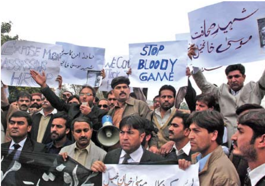
2009 පෙබරවාරියේ දී මුසා බාන් කෙල් සාකච්ඡාව විරෝධය පළ කිරීමට සැරසෙන පෙශාවර් ජනමාධ්‍යවේදීන්

ලඟා වී ඇති බවත් රට දෙකඩ වීමට යන බවත් පාඨකයන් හදිසියේ දැන ගත්තේ 1971 දෙසැම්බර් 17 වන දිනයි. පාකිස්තාන හමුදා පරාජයට පත් වීම පිළිබඳවත් බංග්ලාදේශයේ ජනයාට ඔවුන් සිදු කළ දාමරික කම් පිළිබඳවත් මහජනයා සෙමෙන් අවබෝධ කර ගන්නට පටන් ගත්තේය. එම හේතුවෙන් ජනමාධ්‍ය පිළිබඳව අවිශ්වාසයක් ගොඩ නැගිණි.