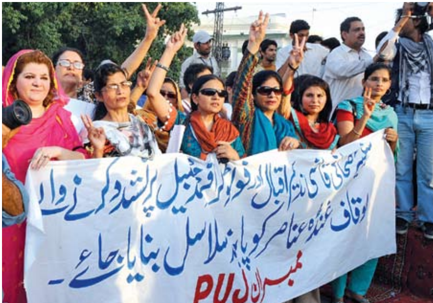
පාකිස්තානයේ වෘත්තීය සංගමයන්හි සක්‍රී සහභාගිත්වය මැන වසරකදී ඉහළ ගොස් ඇත. එය තීරණාත්මක අරගලයන්හි ප්‍රතිපලයකි.

වෙනත්, පෙෂාවෝර්හි මහාධිකරණයට ගෝත්‍රික ප්‍රදේශ පිළිබඳ අධිකරණ බලයක් නොමැත. එමෙන්ම, මුසා ක්හාන් කලීල්ගේ ඝාතනය පිළිබඳ පත් කළ විමර්ශන කමිටුව තවමත් ඒ පිළිබඳ වැඩ අරඹා නොමැත. 2002 පෙබරවාරි මාසයේදී වද හිංසා පමුණුවා මරා දැමුණු චොල් ස්ට්‍රීට් ජර්නල් හි දකුණු ආසියානු කාර්යාංශයේ ප්‍රධානී ඇමරිකානු ජාතික ඩැනියෙල් පර්ල් ගේ ඝාතන සිදුවීම පිළිබඳව පමණක් වේගවත් පරීක්ෂණ සහ සාක්ෂි ඉදිරිපත් කිරීමක් සිදුවූ අතර අහමඩ් ඕමාර් සයිඩ් වරදකරු බවට තීරණය කරන ලදී. ඇමරිකානු බලපෑම මත වේගවත් වූ මෙම පරීක්ෂණය මුෂාරෆ් පෞද්ගලිකව පාලනය කළේය.