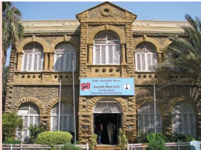
පෞරාණික ගොඩනැගිල්ලක් සහිත කර්විවි ජනමාධ්‍ය සමාජය මාධ්‍ය නිදහසේ දීප්තිමත් මර්මස්ථානයකි.

එමෙන්ම, කවීන්, ලේඛකයන්, සාහිත්‍යකරුවන්, පුවත්පත් හා බැඳුණුවන් සහ පොදුවේ මාධ්‍ය කර්මාන්තයේ සාමාජිකයන් ඇතුළු සාපේක්ෂව පුළුල් පදනමක් සහිත සාමාජිකත්වයකින් හෙබි මෙම ජනමාධ්‍ය සමාජවලින් මාධ්‍යයට සම්බන්ධිත පුද්ගලයන්ගේ ජව සම්පන්න සම්මිශ්‍රණයක් සම්පාදනය විය. තවද, ප්‍රජාතන්ත්‍රවාදය සඳහා ව්‍යාපාරය තුළ ක්‍රියාකාරී ප්‍රගතිශීලී දේශපාලනඥයන් සහ සිවිල් සමාජ සංවිධාන සමග සම්බන්ධතා ඇති කර ගැනීම සඳහා අවස්ථාවක්ද ජනමාධ්‍ය සමාජවලින් මාධ්‍යයට සම්පාදනය විය. උද්ඝෝෂණ, විරෝධතා රැළි සහ හිඳ ගැනීම් ආදී උද්ඝෝෂණ ඔවුන්ගේ ගොඩනැගිල්ල අසලම පැවැත්වීමත්, යුක්තිය ඉල්ලා