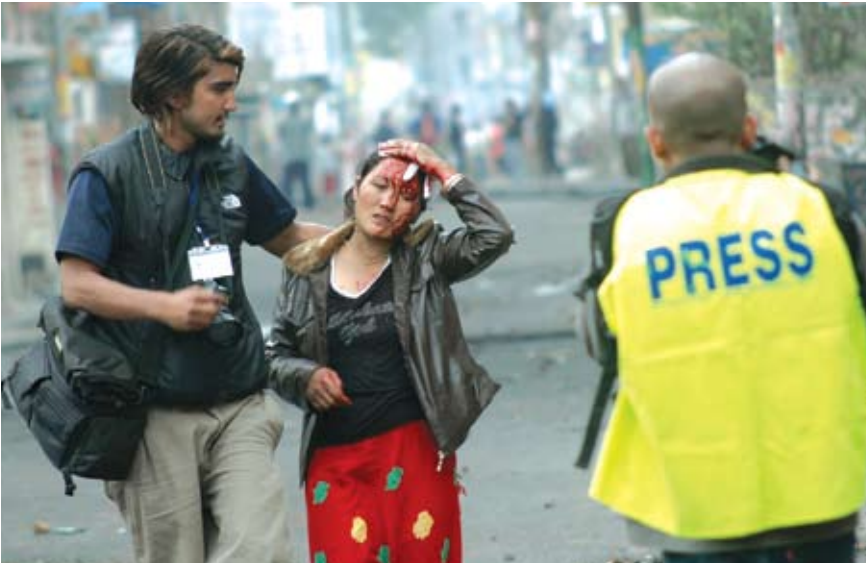
ජායාරූප මාධ්‍යවේදියෙක් කන්මණ්ඩු විදී ප්‍රවන්ඩත්වයකදී තුවාල ලද කාන්තාවකට උදව් වෙයි.

නේපාලයේ ශ්‍රේෂ්ඨාධිකරණය, කැරලි සහ විරෝධතා ව්‍යාපාර අතරතුර කාලයේ ප්‍රජාතන්ත්‍රවාදය සහ නීතියේ ආධිපත්‍ය නැවත පිහිටුවීම සඳහා සුවිශේෂ කාර්ය භාරයක් ඉටු කළේය. නීත්‍යනුකූල නොවන අත්අඩංගුවට ගැනීම් සහ රඳවා තැබීම, වද හිංසා පැමිණවීම් සහ නීතියට අනනුකූලව ඝාතන සිදු වූ අවස්ථා කිහිපයකදීම අධිකරණය විසින් හඬයාස් කෝපුස් අඥාපනත යටතේ නීති විරෝධීව