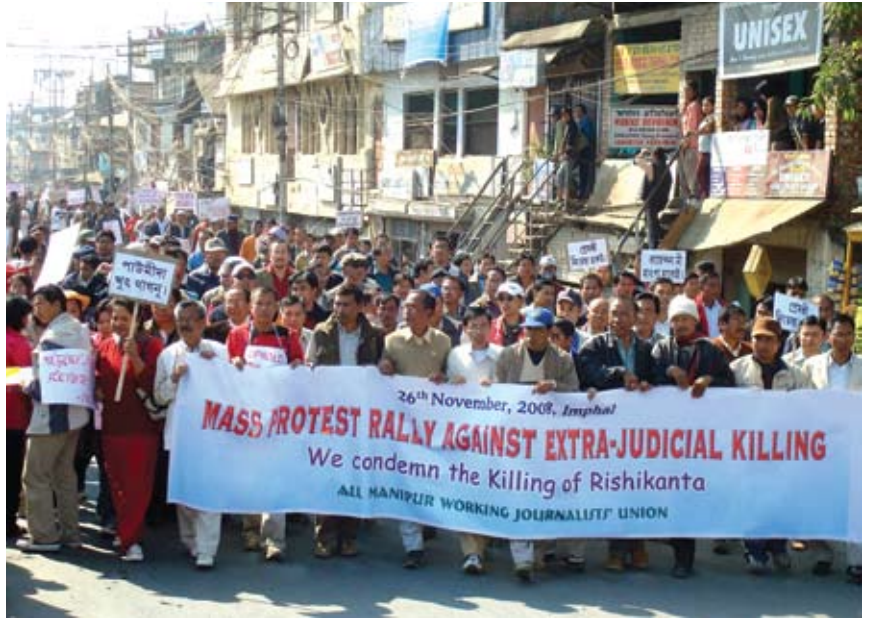
සාසියසන්බල් සබ්බෝ. පමරාඋර සබ ඒබසවමරි. ජවසඵක ජසඵන සබ හදඩැපඉර 2008ල කැ එද 'බ ැසටයඵ-ඵන කදබට 'ටසඵඵසදබ :වයදඵදි ජදමරඵඵහල්දඉයඵඵඵඵඵඵඵඵඵ*

සමග සානනයට ලක් වුවත් පැවැත්වූ සමීපත්වය බව පෙන්වුම් කරන ඒකාන්ත සාක්ෂි ඉදිරිපත් වී නැත. එසේ සාක්ෂි තිබුණද ඒවා වගකිව යුතු පුද්ගලයන් අල්ලා ගැනීමේ අවශ්‍යතාවය නැති නොකරයි.