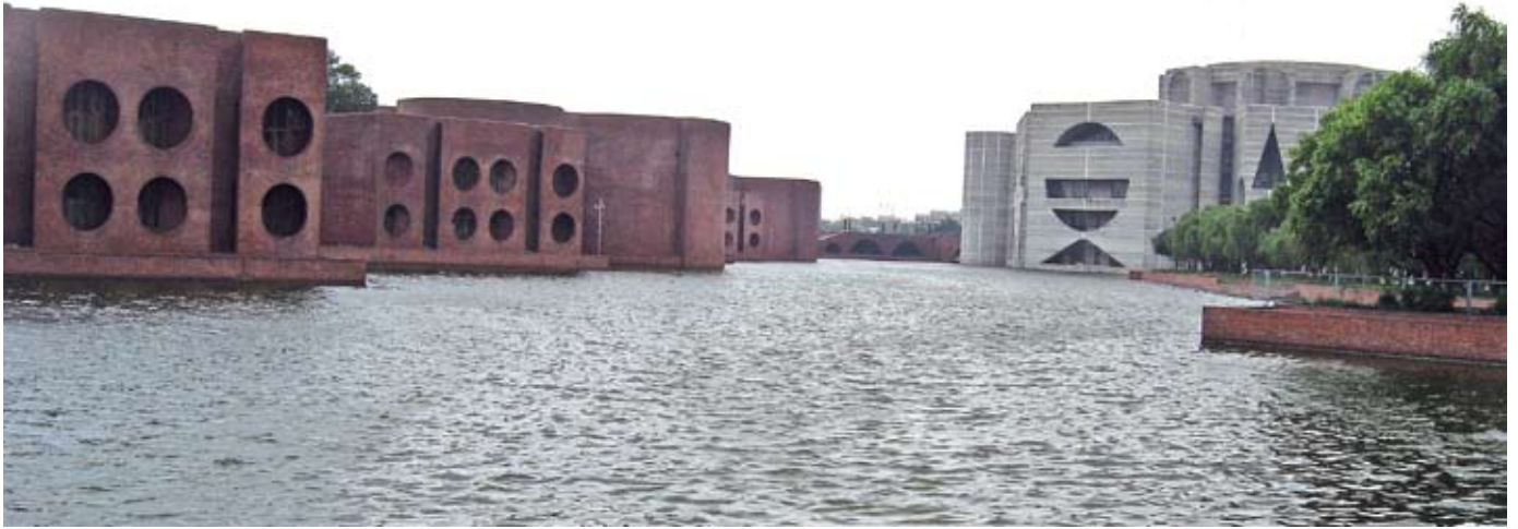
පාර්ලිමේන්තුව විරුද්ධ පාක්ෂික දේශපාලනය සඳහා යෝග්‍ය ක්ෂේත්‍රයක් ලෙස නොසැලකෙන අතර එය වැඩිවැඩියෙන් සිදුවන්නේ ජනමාධ්‍යයෙහි සහ විදියෙහි ය.