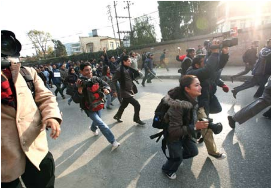
තමන් මුහුණ දෙන තර්ජන සහ අහියෝග මැද නේපාල ජනමාධ්‍යවේදීහු සෑම එසැණ පුවත් අඩවියකම සෑම විටම ක්‍රියාකාරීය.

"රජය නේපාලයේ ප්‍රවෘත්ති ජනමාධ්‍ය තහනම් කළ හොත් පුවත් පත් සහ ගුවන් විදුලි ප්‍රචාර ගෙන ඒම සඳහා නේපාල දේශසීමා ඔස්සේ ඉන්දීය නගරවල ජාලයක් ජනමාධ්‍යවේදීන් කණ්ඩායමක් විසින්, ගොඩනංවා තිබුණි" යැයි වැඩියෙන්ම බෙදා හැරෙන ඉංග්‍රීසි මාධ්‍ය පුවත් පත වන කන්මන්ඩු පොස්ට් හි එවකට සිටි කර්තෘ වරයා වන ප්‍රතික් ප්‍රධාන ප්‍රකාශ කළේය. කෙසේ වෙතත්, ජනමාධ්‍යවේදීන්ගේ මේ ආකාර ප්‍රතිරෝධයන්ට ප්‍රතිචාරය වූයේ මර්දනය ඉහළ යාමය. ජනයාට ස්වාධීන ප්‍රවෘත්ති මූලාශ්‍රයක් අහිමි වීමට අමතරව තව