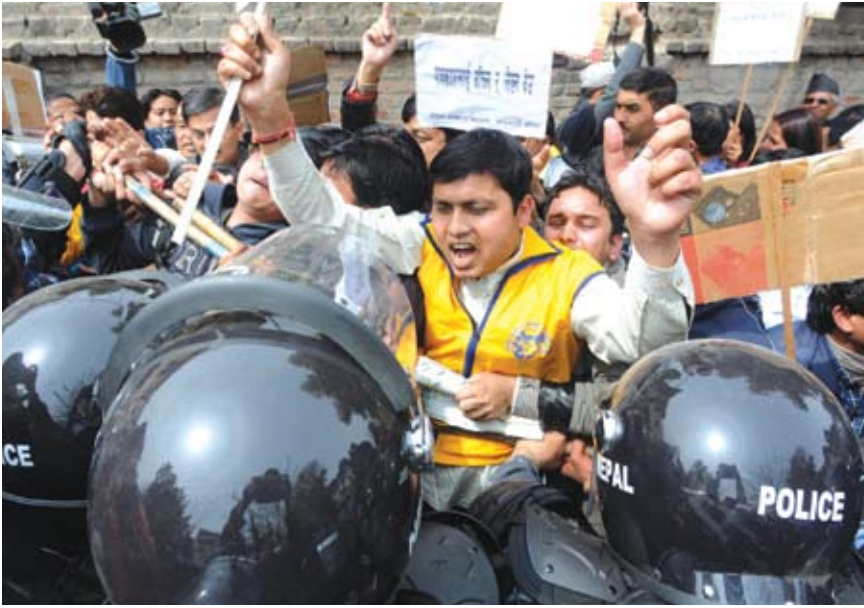
මාධ්‍ය ව්‍යාපාරික අරුත් සිංහානියා සාකච්ඡා විරෝධතා දක්වන ජනමාධ්‍යවේදීන් කන්මන්ඩුහි දී කැරලි මර්දන පොලීසිය සමඟ ගැටෙති.

දැයි විස්තර කරමින් "සමාජයේ පා වැසුම්" ("Socks in Society") නම් මු උපහාසාත්මක කතු වැකියක් ප්‍රකාශයට පත් කළේය. නේපාලේ ටයිම්ස් සහ හිමාලේ ක්ෂාත්‍රපත්‍රිකා යන පුවත්පත් වාරණයට ලක් කැරුණු පුවත් තිබූ තැන් හිස්ව තැබූහ. දේශාන්තර් සහ බිමාර්ස් වැනි සතිපතා පුවත්පත් කතු වැකිය සඳහා වූ ඉඩ හිස්ව තබමින් පත්වාගෙන ගිය මුරණ්ඩු නිශ්ශබ්දතාවය තවත් එක් උපක්‍රමයක් විය. මෙම බලවත් විරෝධය හේතුවෙන් ප්‍රාදේශීය සිවිල් පරිපාලනයේ ඉහලම නිලධාරියා වූ කන්මන්ඩු හි ප්‍රධාන දිස්ත්‍රික් නිලධාරීවරයා විසින් කර්තෘ වරුන් 5 දෙනෙක් කැඳවා ඔවුන්ගෙන් ප්‍රශ්න කරන ලදී. එම කර්තෘවරුන්ව මුදා හැරුණේ බලධාරීන් ඔවුන්ව කැඳවන ඕනෑම අවස්ථාවක වාර්තා කිරීමට පොරොන්දු වෙමින් ප්‍රකාශයක් අත්සන් කිරීමෙන් පසුවය.