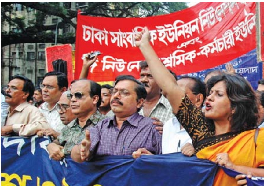
හදිසි නීති පාලනය විසංවාදයට මර්දනය කළේ ය. එසේ නමුත් ජනමාධ්‍යවේදීහු සිය සාධාරණ ඉල්ලීම් විදියට හෙතෙමාම තර කරනාකළහ.

අවිශ්වාසය කොතරම් ගැඹුරුද කිවහොත් සමස්ත ප්‍රජාතන්ත්‍රවාදී ක්‍රියාවලිය නවතා "හදිසි නීති පාලනයක්" ඇති කරන ලදී. එහි ප්‍රධානීන් ලෙස පිටතට පෙනුනේ සිවිල් සමාජයේ උසස් නිලධාරීන් පිරිසක් වුවද සැබැවින් ම යටින් ක්‍රියාත්මක වූයේ හමුදා බලයයි.